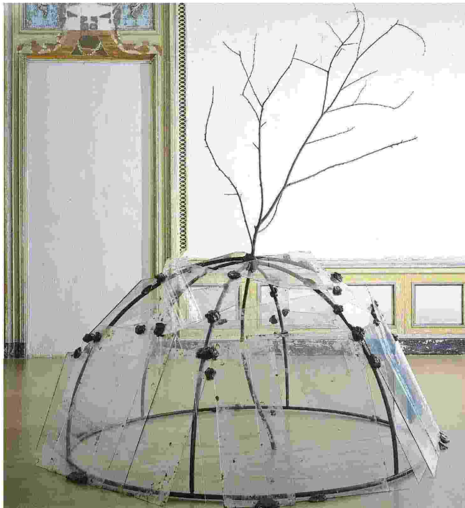
Mario Merz, "Igloo con albero", 1968. Opera esposta alle OGR di Torino nella mostra "Naturecultures"

I Dialoghi di Pistoia tornano da domani a domenica 29 maggio. La XIII edizione del Festival di antropologia del contemporaneo vedrà gli interventi di antropologi, filosofi, scrittori, storici, psicoanalisti, comunicatori, artisti per offrire nuovi sguardi sulle società umane. Il tema del 2022 Narrare humanum est. La vita come intreccio di storie e immaginari affronterà l'importanza e la centralità della narrazione per il genere umano in ogni epoca, cultura e contesto. Elvira Mujic intervorrà il 29 al teatro Manzoni in dialogo con l'antropologo Marco Aime.